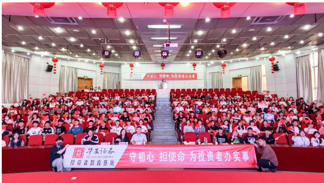
安徽辖区华安证券投教基地走进高校。