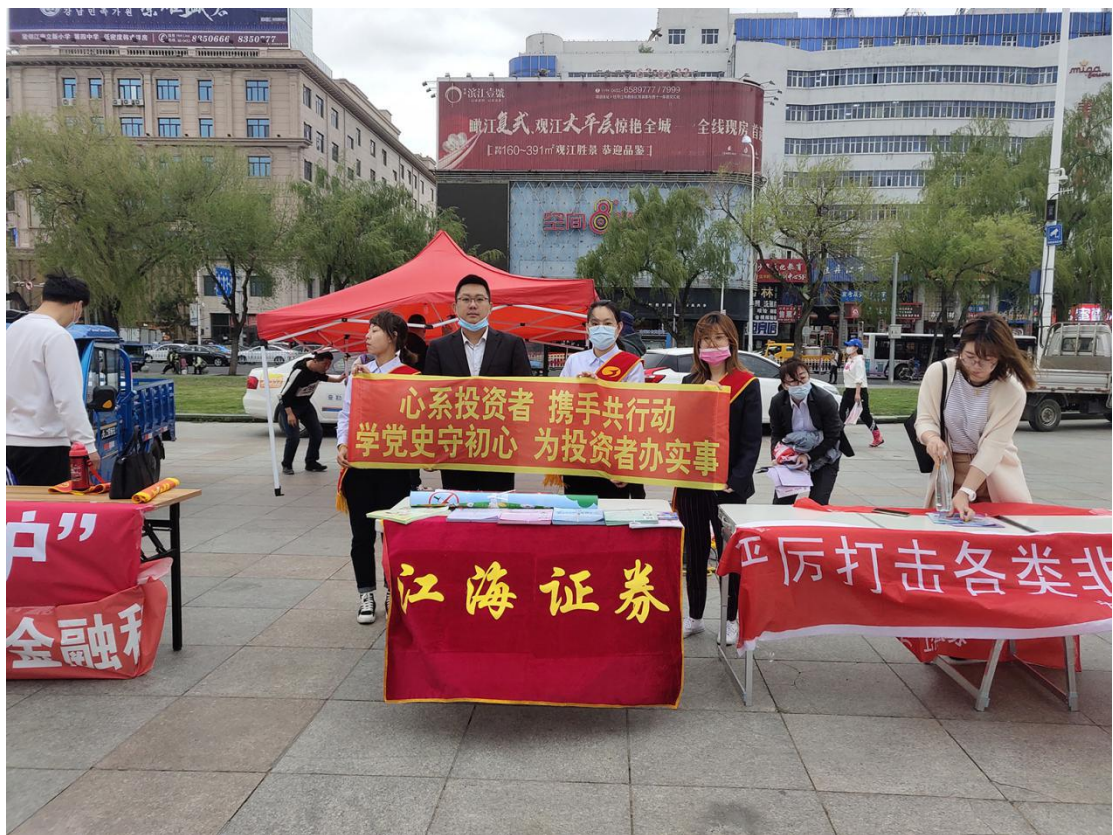
黑龙江辖区江海证券投教基地开展宣传活动。