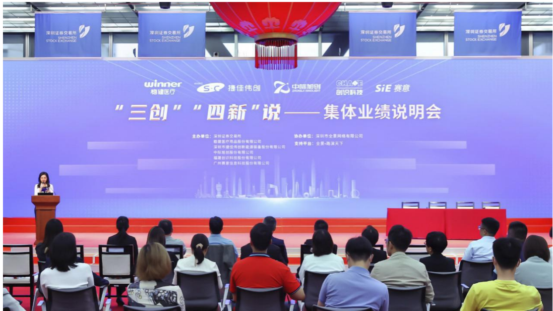
深交所举办创业板上市公司集体业绩说明会。