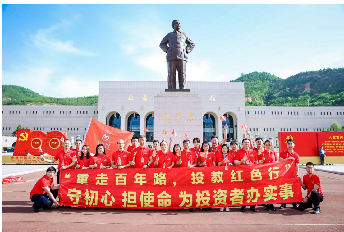
“重走百年路，投教红色行”延安站活动举办。