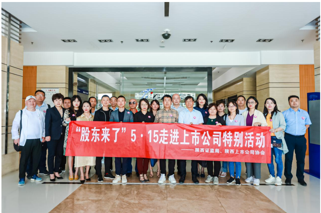
陕西证监局联合投服中心开展“5·15”走进上市公司活动。