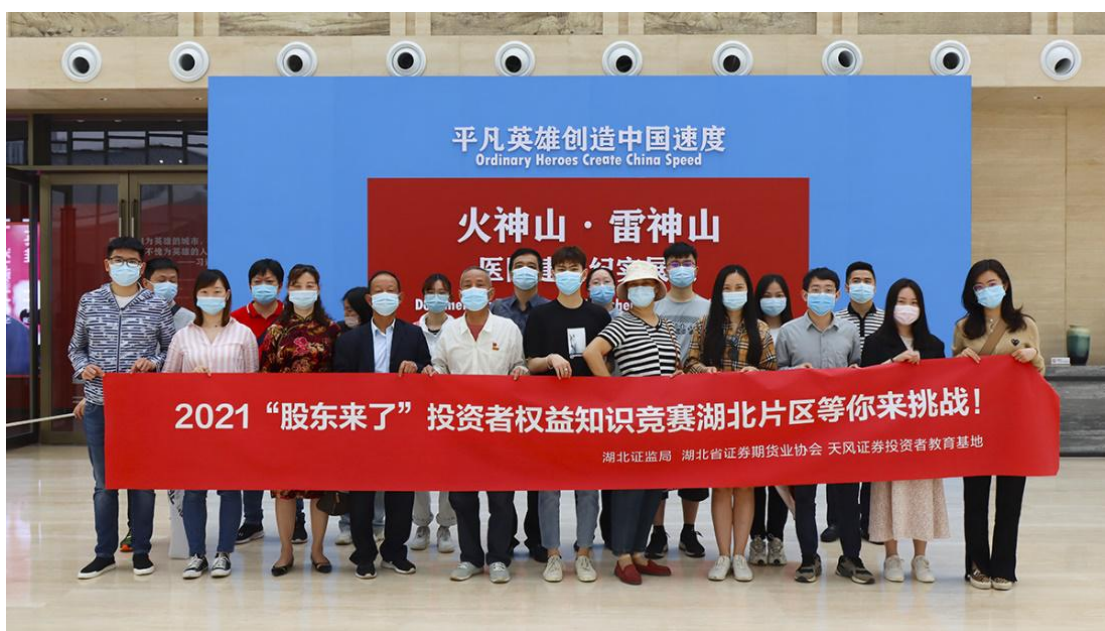
湖北辖区组织证券期货从业人员及投资者代表参观“火神山、雷神山医院建设纪实录展”。