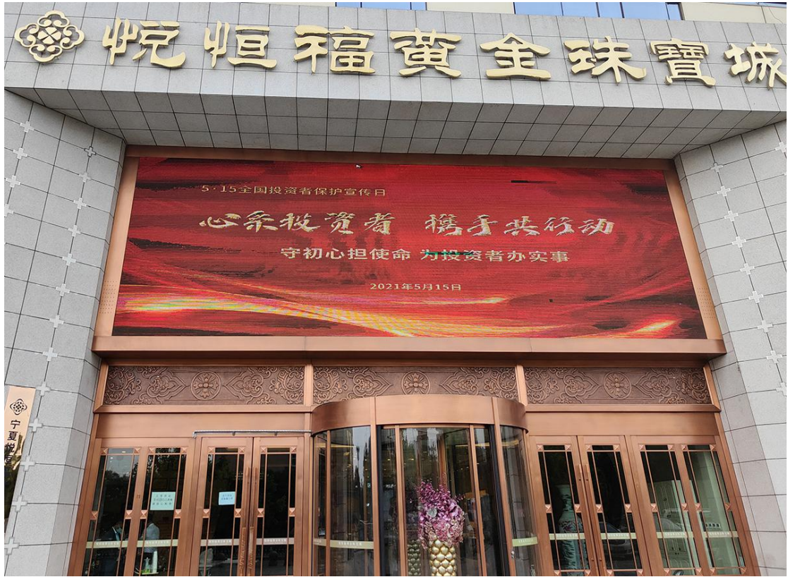
宁夏辖区通过商场电子屏展示投资者保护宣传标语。