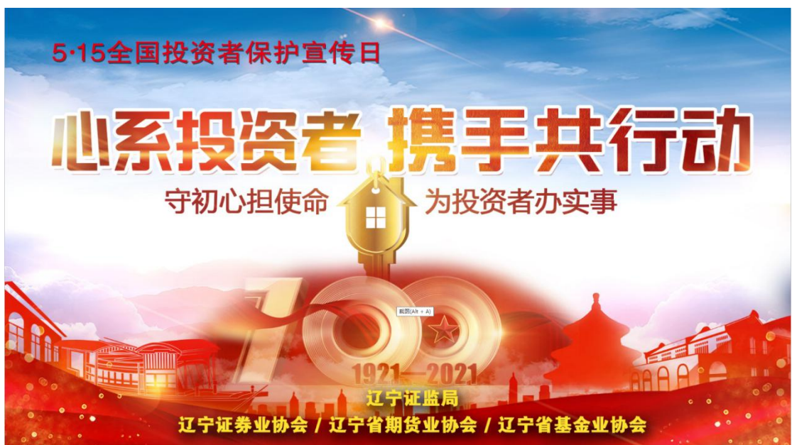
辽宁辖区制作5·15“守初心担使命 为投资者办实事”主题电子海报。