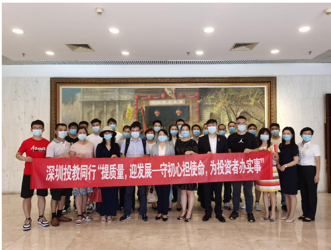
深圳辖区“投教同行”组织投资者学习红色金融史。