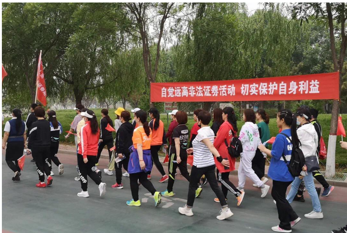
河北辖区财达证券投教基地携手各分公司举办健步走活动。