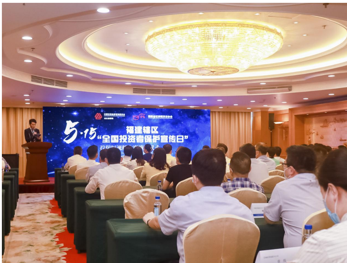
福建辖区举办“5·15 全国投资者保护宣传日”投保短视频大赛颁奖仪式。