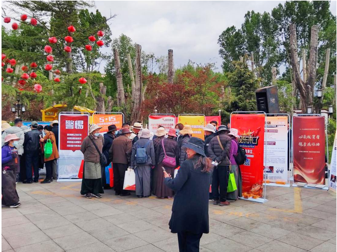
西藏辖区组织 5·15 全国投资者保护宣传日现场宣传。