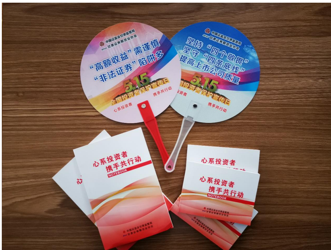
甘肃辖区制作 5·15 投保、防非主题投教产品。