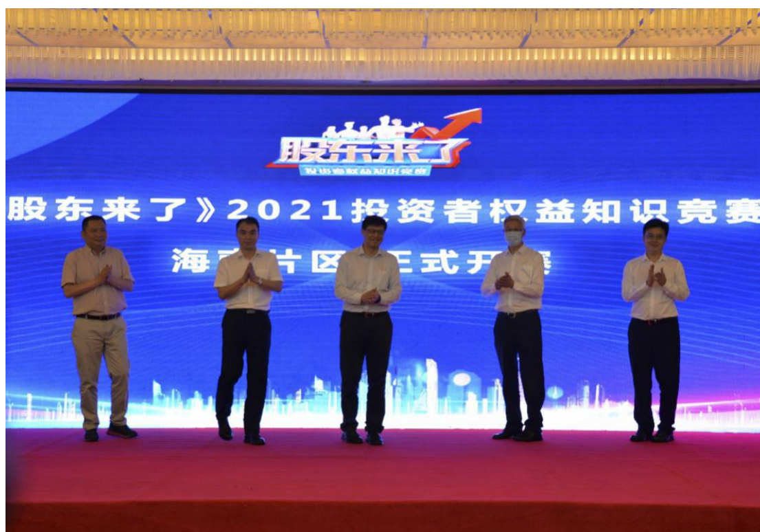
海南辖区组织开展《股东来了》2021 投资者权益知识竞赛海南片区启动仪式。