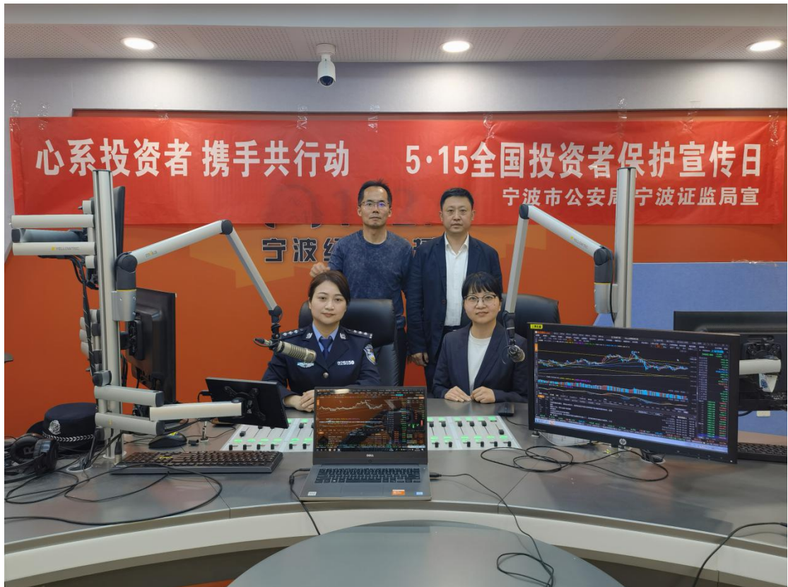
宁波证监局联合公安机关在电台录制 5·15 特别节目。