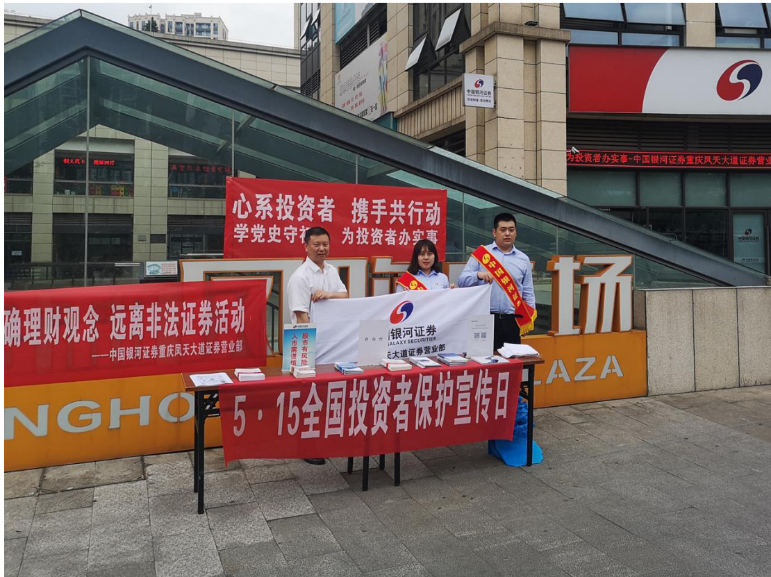
重庆辖区组织证券经营机构开展户外宣传。