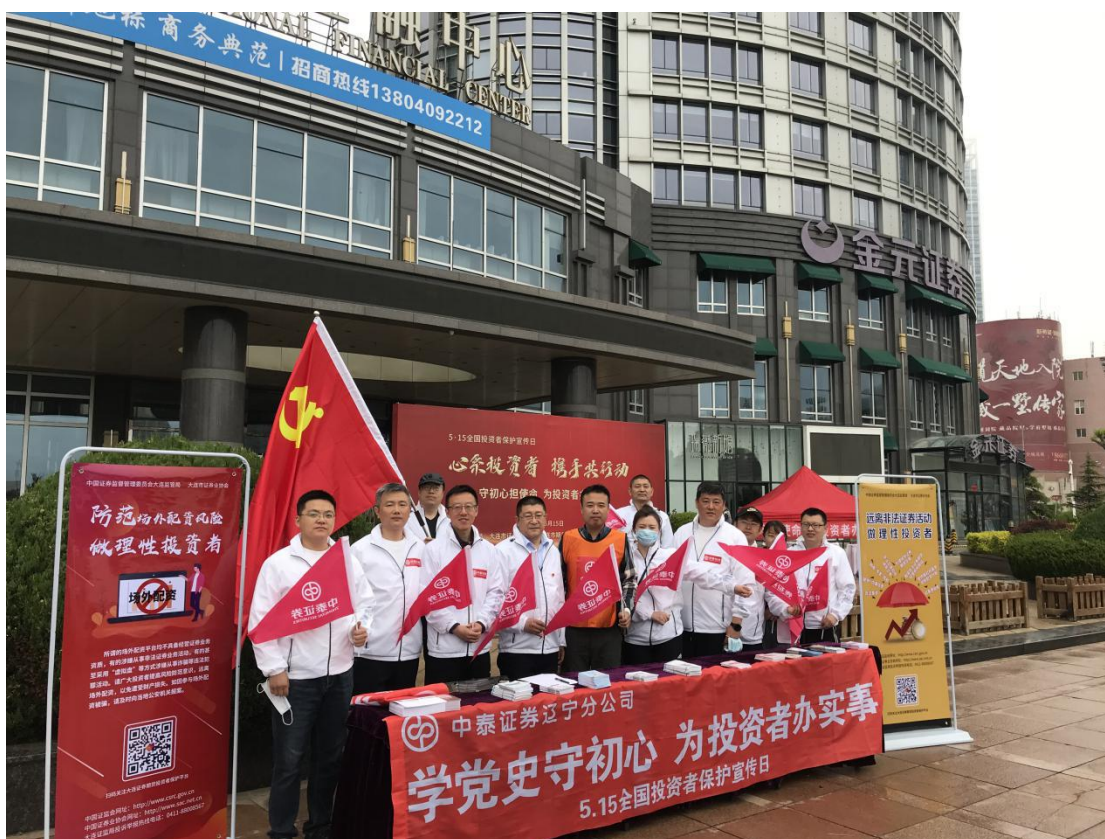
大连辖区组织证券经营机构开展投资者保护宣传活动。