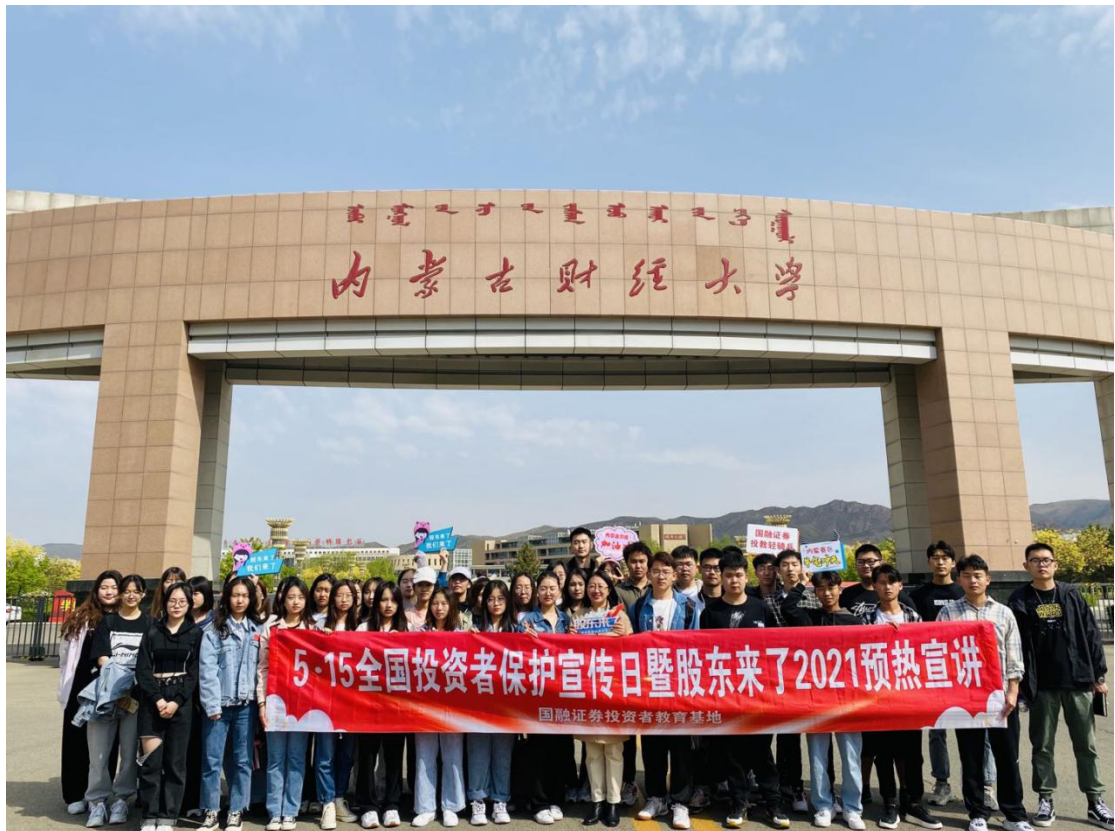
内蒙古辖区国融证券投教基地走进内蒙古财经大学。