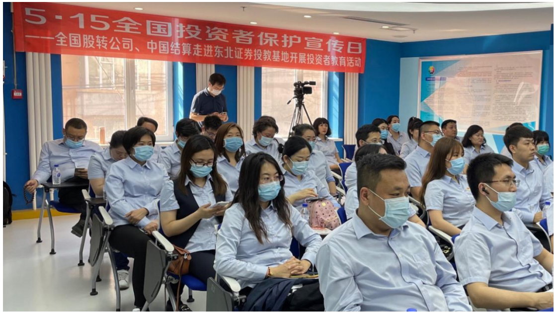
全国股转公司联合中国结算举办“走进主办券商”系列活动。