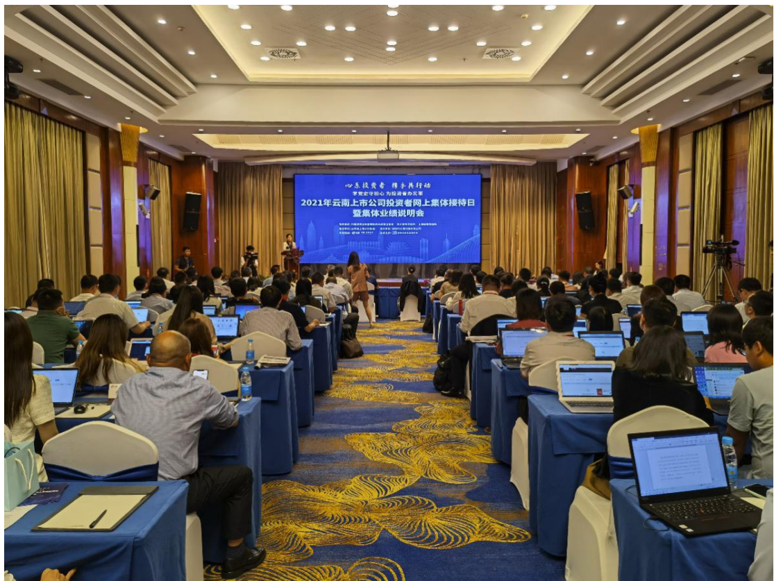
云南辖区举办举办 2021 年上市公司投资者网上集体接待日活动。