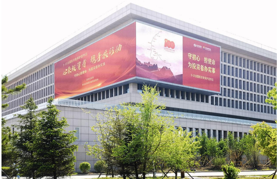
吉林辖区在城市文化中心展示投资者保护宣传标语。