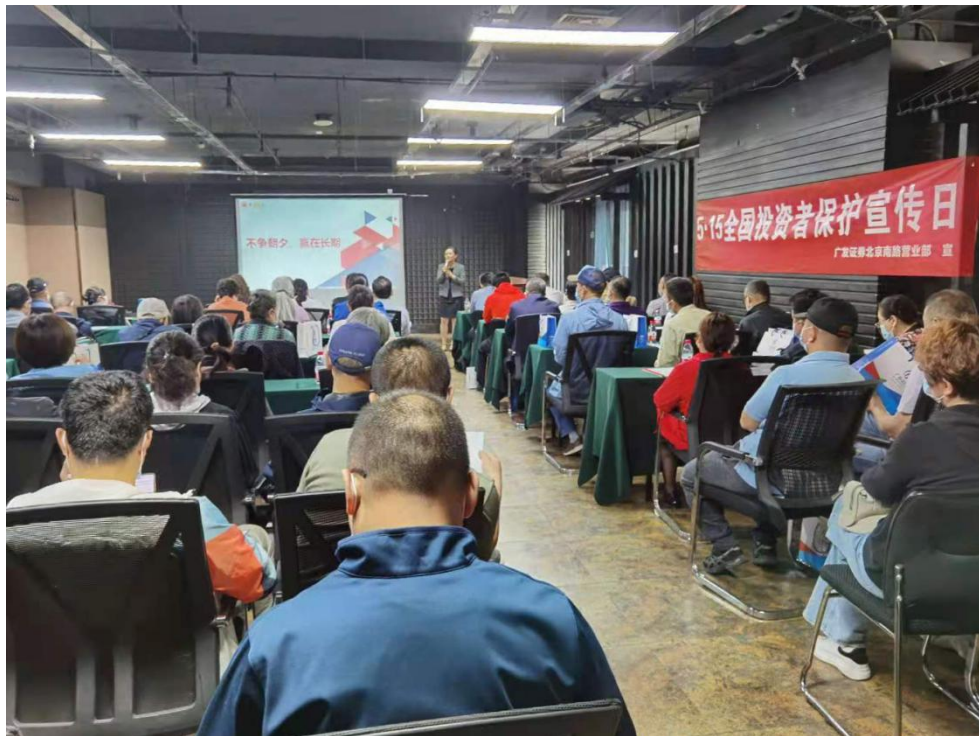
新疆辖区各市场主体开展投资者保护宣传活动。