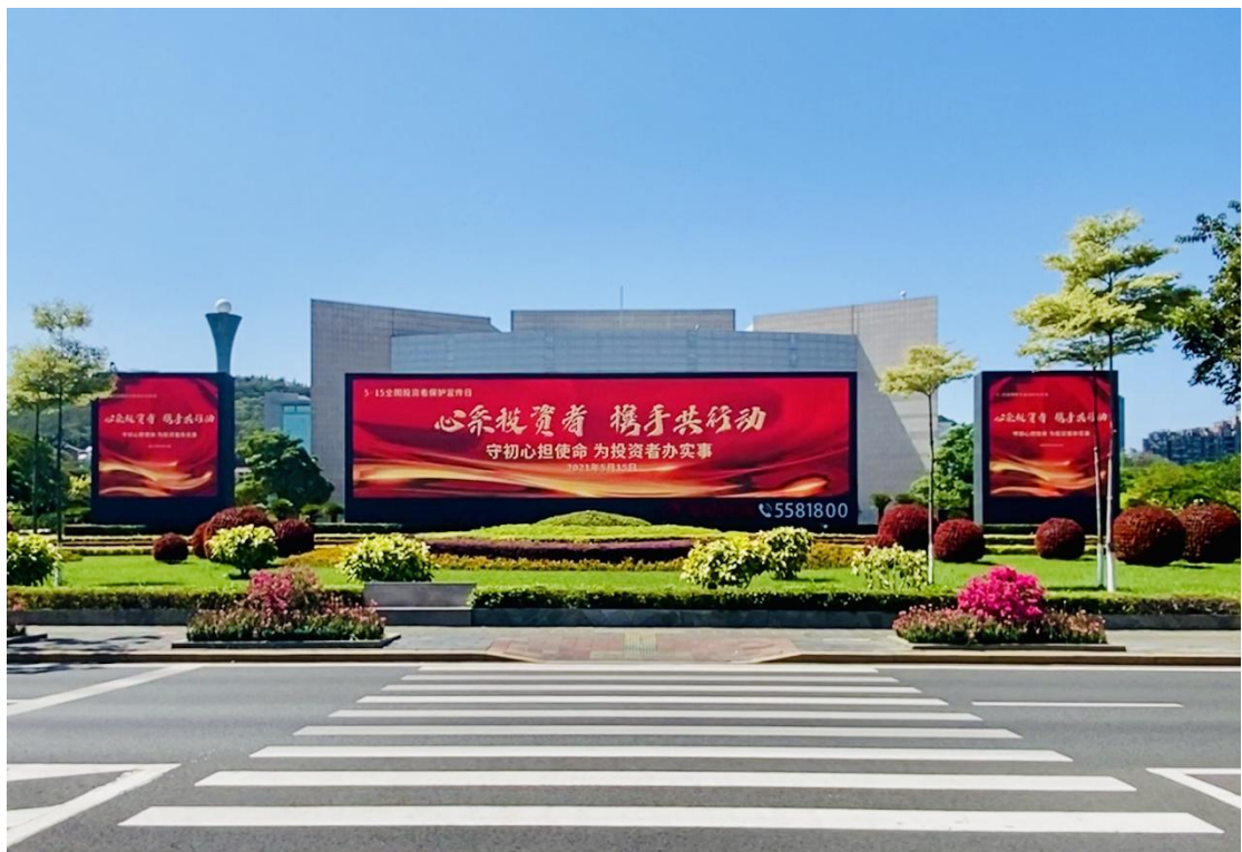
厦门辖区在厦门市人民大会堂巨幕投放“5·15 全国投资者保护宣传日”海报。