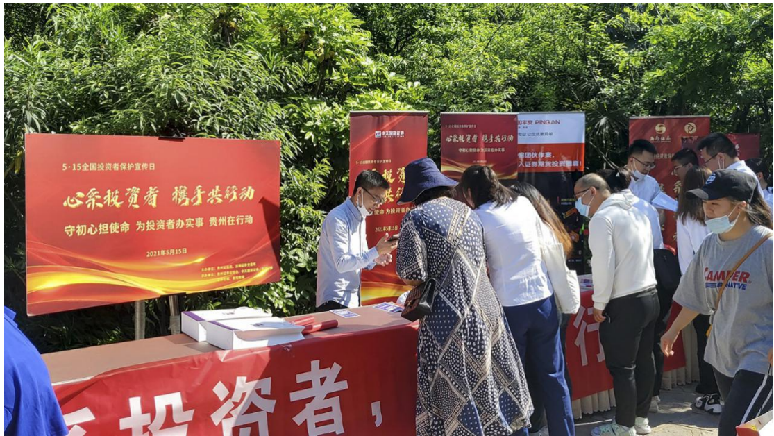
贵州辖区举办走进解放贵州革命烈士纪念碑活动。