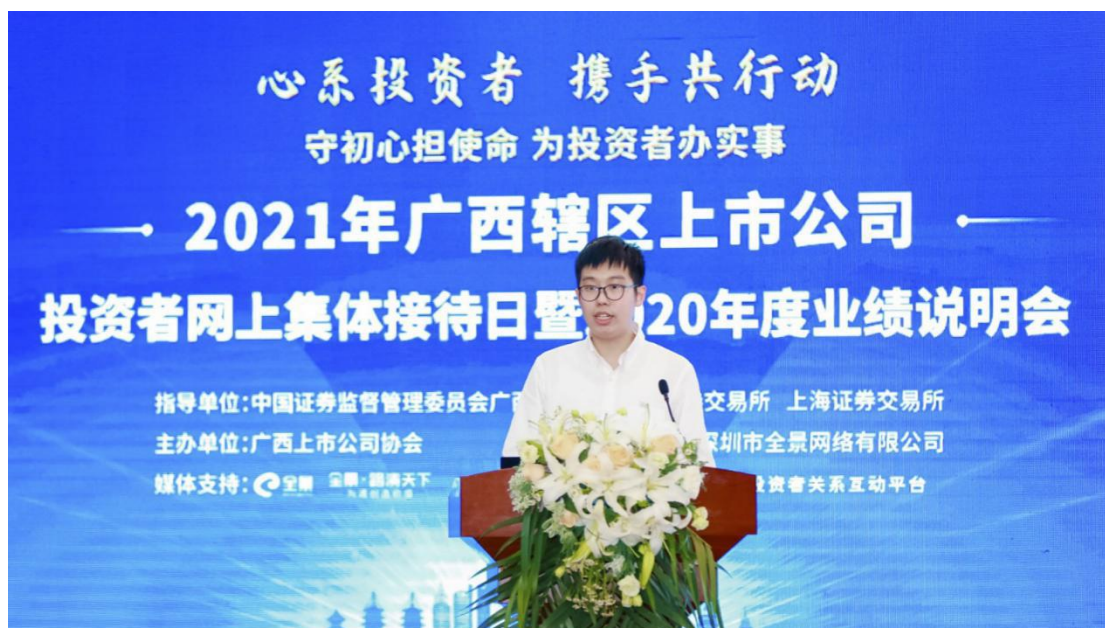
广西辖区举办 2021 年上市公司投资者网上集体接待日暨 2020 年度业绩说明会。