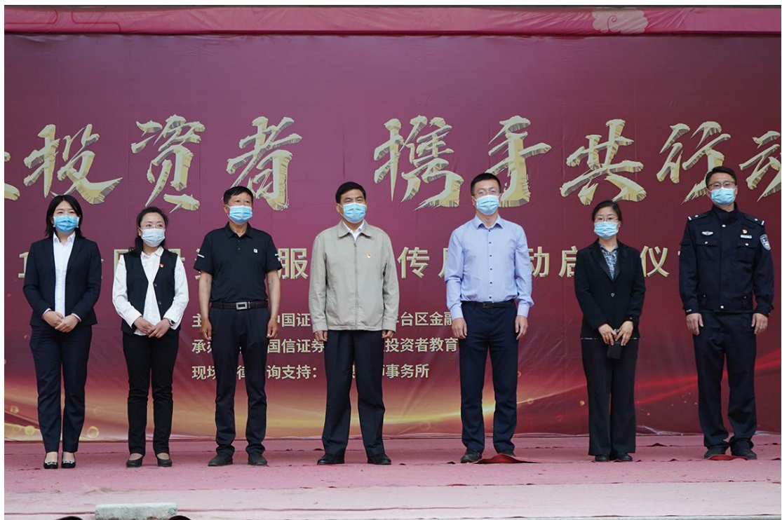
证券业协会举办“5·15”投教进社区系列活动。