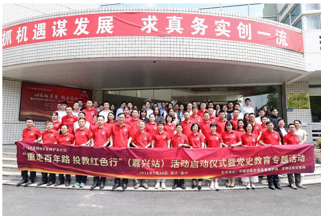
“重走百年路，投教红色行”嘉兴站活动举办。