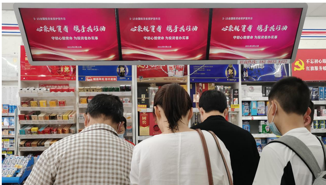
四川辖区上市公司通过超市大屏幕展示 5·15 活动海报。