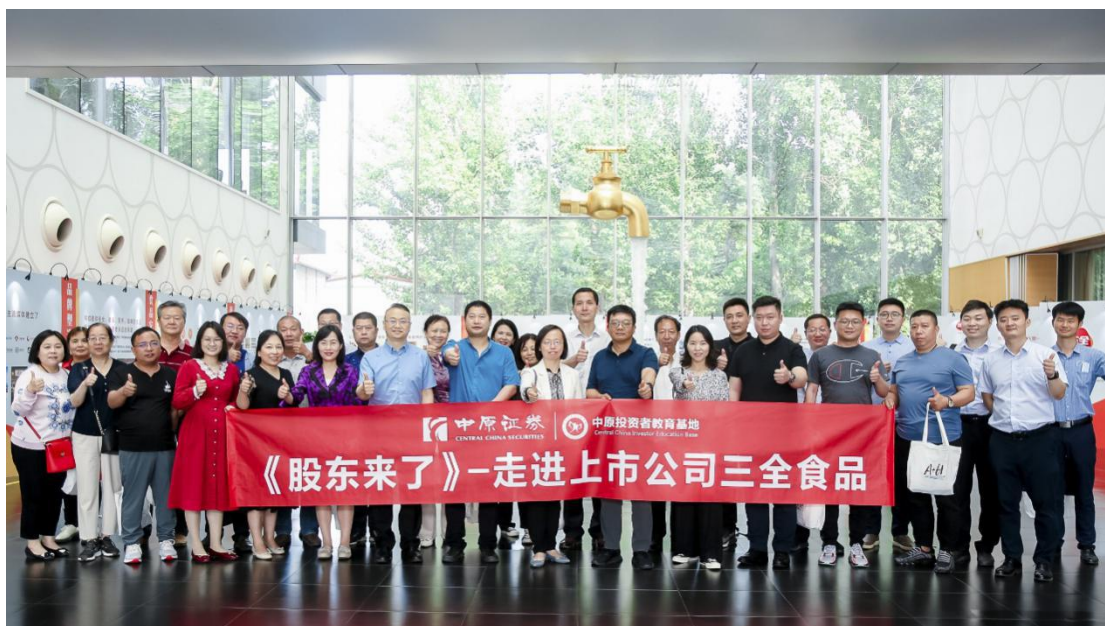
河南证监局联合投服中心举办股东来了特别活动，组织投资者走进辖区上市公司。