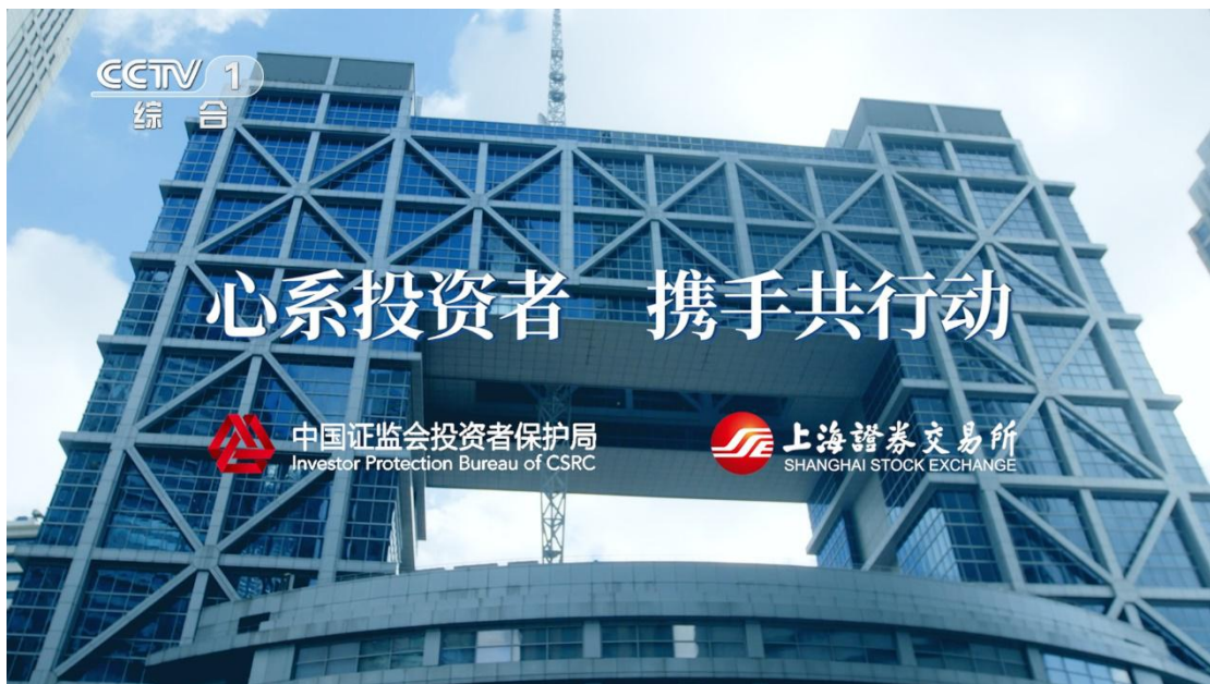
上交所制作“心系投资者，携手共行动”主题公益广告通过 CCTV-1 综合频道播出。