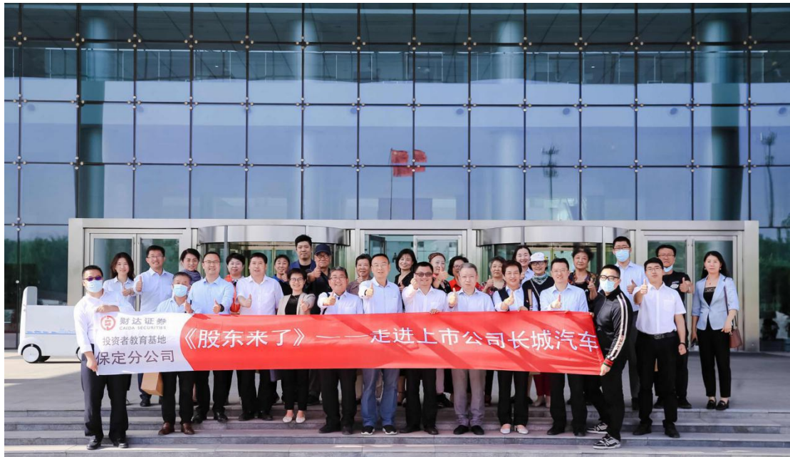
投服中心举办《股东来了》走进上市公司特别活动。