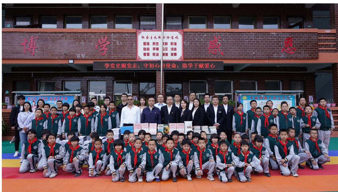
山西辖区四家投教基地走进革命老区吕梁兴县千城明德小学。