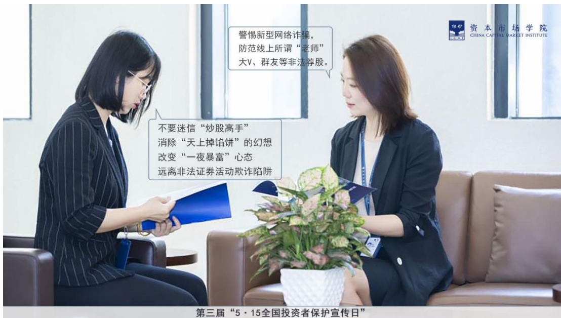
资本市场学院利用实体校园特点，在校园公共区域屏幕展示“5·15全国投资者保护宣传日”宣传图。