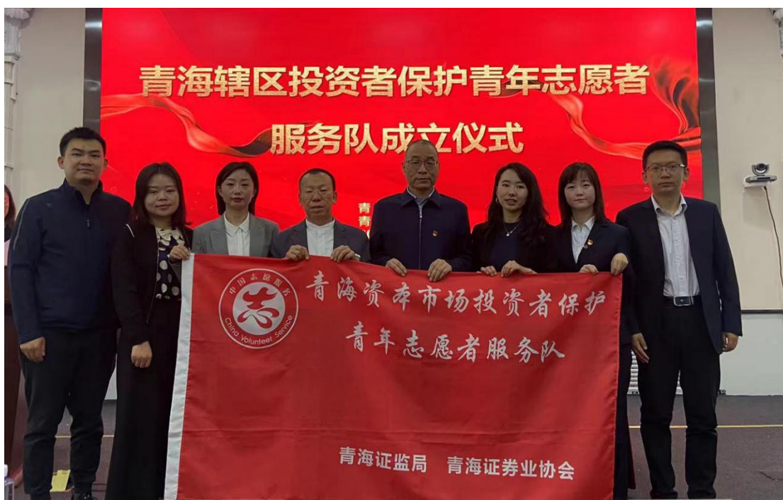
青海辖区成立投资者保护青年志愿者服务队。